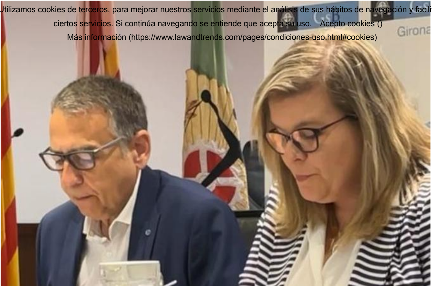
JAUME FRANCESCH (PRESIDENT DEL CONSELL) MONTSERRAT CERQUEDA (VICEPRESIDENTA DEL CONSELL)

Utilizamos cookies de terceros, para mejorar nuestros servicios mediante el análisis de sus hábitos de navegación y facilitar ciertos servicios. Si continúa navegando se entiende que acepta su uso. Acepto cookies () Más información ( https://www.lawandtrends.com/pages/condiciones-uso.html#cookies )