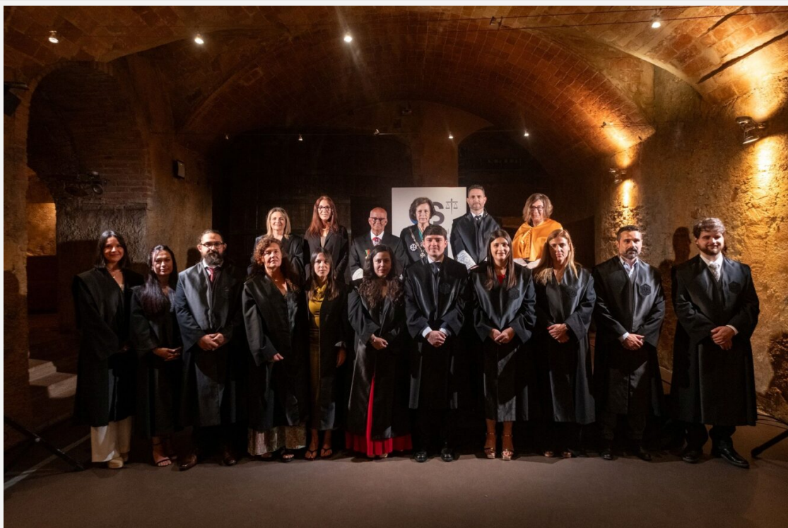
Un moment de l'acte celebrat divendres.