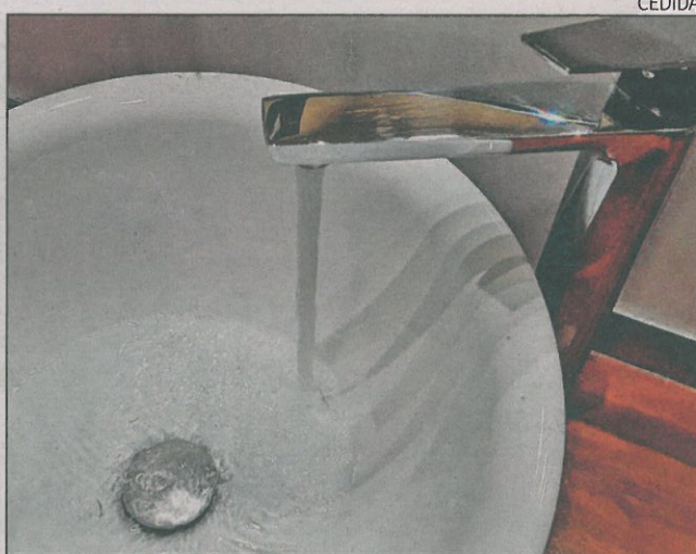
Imatge d'arxiu d'una aixeta amb aigua rajant.

Pel que fa a la diferència de tarifes, l'estudi alerta que es pot arribar a pagar el triple pel mateix