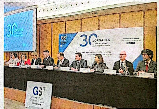
Les jornades es van inaugurar ahir.

Tarragona acollirà el 4 de juliol el lliurament dels Premis Nacionals de Comunicació. Ho ha anunciat el secretari de Mitjans de Comunicació i Difusió, Carles Escolà. Serà la primera vegada que el lliurament es faci fora de Barcelona. Carles Escolà va destacar la «descentralització» dels premis que passen a ser «itinerants». El Govern aprovà una reformulació dels premis per incorporar una categoria per a cada suport i el Premi Nacional d'Honor, per reconèixer la trajectòria professional d'aquelles persones que han esdevingut un referent en la comunicació a Catalunya o en llengua catalana.