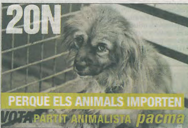
Propaganda de Anticapitalistes, que estos días protesta ‘okupando’ sedes bancarias, y de la formación antitaurina del Pacma.

munista de España, Partit Republicà d'Esquerra-Republicans, y, en el otro extremo, la xenófoba Plataforma per Catalunya, hasta opciones con objetivos muy concretos y definidos, como el Partit Animalista-Pacma, centrado exclusivamente en la defensa de los animales.