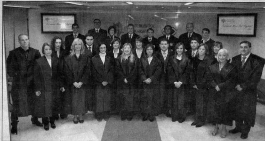
Imatge de grup dels nous graduats socials a Tarragona.